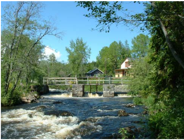
Gådeå kvarn.