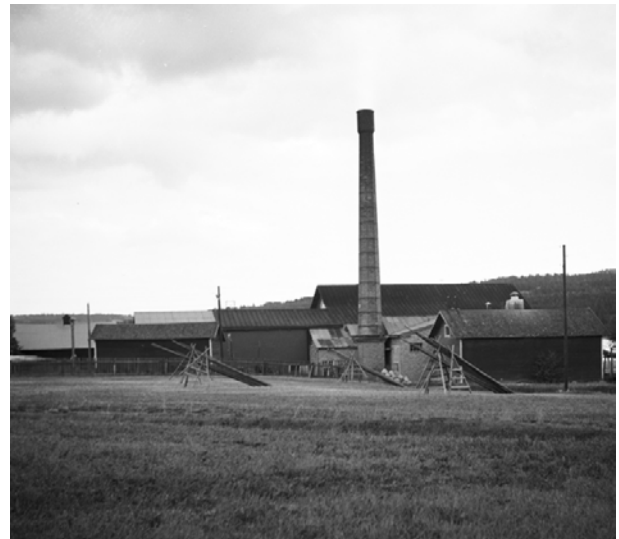
Lövuddens ångsåg

I Härnösand fanns mellan 1850 och 1950 fyra ångsågar. En av dem, Lövuddens ångsåg, var i drift från 1903 till 1950. Sågen omfattade även hyvleri och snickerifabrik. Lövuddens sågverk sysselsatte vid full drift omkring 60 man. Av sågen återstår nu enbart grunder och fundament. Av kajerna syns ribb och enstaka pålar.