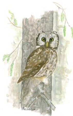
Pärluggla : Illustration Helena Winberg