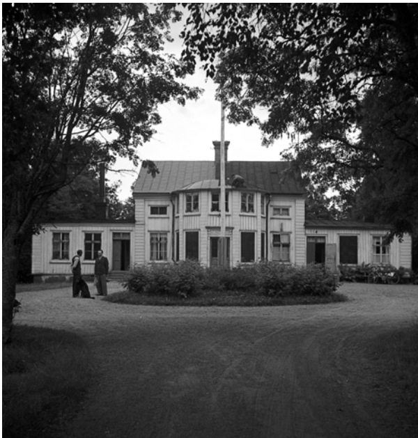
Lövuddens herrgård